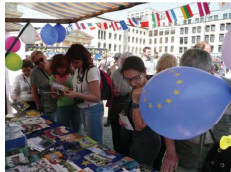
Großes Gedränge am Infostand der Bezirke