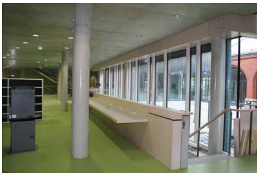
Innenansicht Mittelpunktbibliothek Treptow

Bezirksmittel 3,8 Mio. € ERFE-Mittel: 1,3 Mio. €