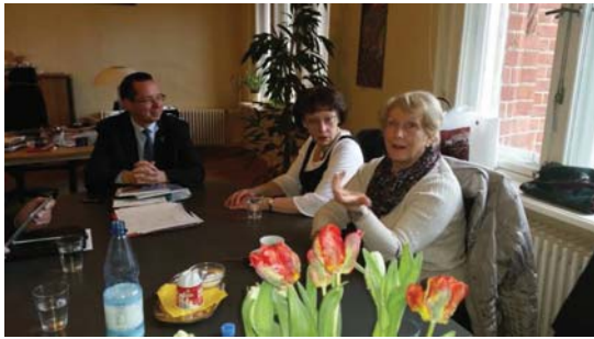
Empfang der österreichischen Freiwilligen beim Bürgermeister