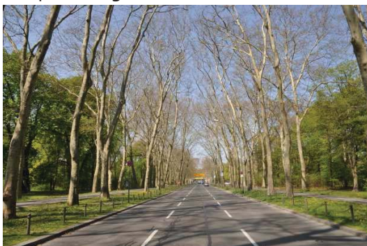
Puschkinallee mit den berühmten Platanen

Puschkinallee : Revitalisierung der vierreihigen denkmalgeschützten Platanenallee durch umfangreiche Schnittmaßnahmen, inkl. Rodung im Kronenbereich zur Freistellung der Platanen sowie Neupflanzung für Lückenschluss