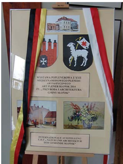
Kunstaussstellung in Słońsk