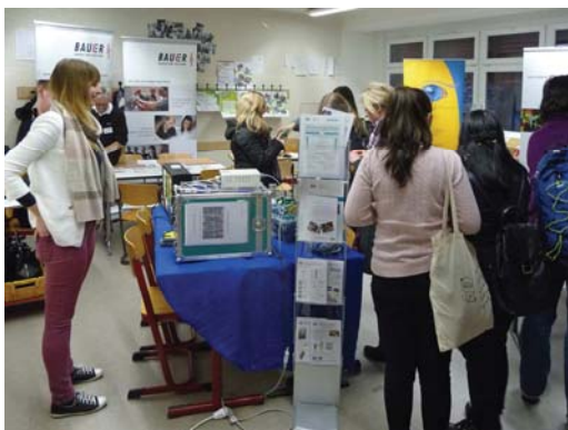
Elternwerkstatt in der Emmy-Noether-Schule

Die Elternwerkstatt „Mehr Mädchen in MINT- Berufen“ war ein voller Erfolg. Gemeinsam mit dem Lokalen Aktionsbündnis „Mehr Mädchen in MINT in Treptow-Köpenick“ lud das Emmy-Noether-Gymnasium am 19.02.2015 erstmalig zur Elternwerkstatt ein. Etwa 70 Eltern und Schülerinnen informierten sich in einer unterhaltsamen Veranstaltung über aktuelle Entwicklungen in den naturwissenschaftlich-technischen Berufsbereichen und entdeckten spannende Berufsfelder der Zukunft. Unternehmen aus dem Bezirk präsentierten sich mit ihren attraktiven Berufsausbildungsangeboten. Studierende aus Hochschulen vom Campus Adlershof und dem Standort Oberschöneweide berichteten anschaulich über MINT-Studienfächer. Bildungsorganisationen stellten spezielle Berufsorientierungsangebote für Mädchen und Ausbildungsangebote in MINT-Fächern vor. Im Technik-Berufe-Parcours von LIFE e.V. erprobten Schülerinnen ihr technisches Geschick und erfuhren, in welchen Berufen sie diese einsetzen können.