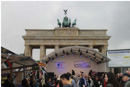
Berlin wählt Europa

Am 9. Mai 2014 fand unter dem Motto "Berlin wählt Europa!" das Europafest auf dem Pariser Platz vor dem Brandenburger Tor statt. Veranstalter des Europafests sind die Berliner Senatskanzlei, die Vertretung der Europäischen Kommission und das Informationsbüro des Europäischen Parlaments in Deutschland. Zahlreiche Berliner/innen und Gäste der Stadt nutzten das Angebot, sich an den Informationsständen von europäischen und europapolitisch aktiven Organisationen, Vereinen und Initiativen über die EU und die Europawahlen zu informieren. Die Europabeauftragten der Berliner Bezirke beteiligten sich mit einem Gemeinschaftsstand an dieser Aktion, beantworteten Fragen des Publikums und präsentierten ihren Bezirk.