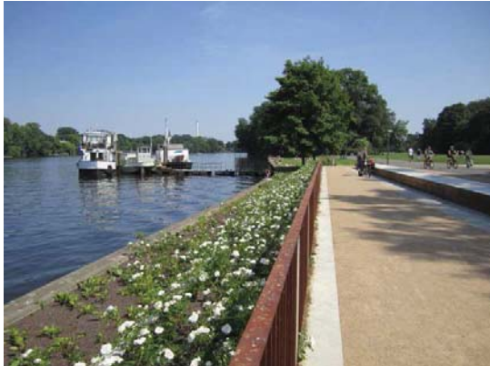
Spreeufer im Treptower Park

Rosengarten: Neugestaltung der Wege und Platzflächen sowie die Wasseranlagen (Springbrunnen, Wasserbecken) gemäß ursprünglicher Planung aus den 60er Jahren, inkl. Erweiterung durch Bau des ursprünglich geplanten Ufersitzplatzes sowie komplette Neupflanzungen der Rosen gem. heutiger Erfordernisse und Ansprüche.