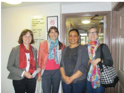
Studienbesuch in Birmingham

Die Europäische Integration stellt Kommunen immer wieder vor neue Aufgaben und Herausforderungen. Transnationales Arbeiten in projektbezogenen, grenzüberschreitenden Zusammenhängen erfordert interdisziplinäres Arbeiten, Flexibilität interkulturelle Kompetenz und Fremdsprachenkenntnisse. Mithilfe von Auslandspraktika qualifizieren sich seit einigen Jahren Verwaltungsbeschäftigte der Berliner Bezirke für diese Aufgaben.