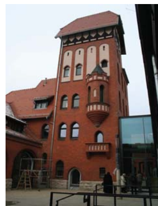
Lesehof Mittelpunktbibliothek mit Alter Feuerwache