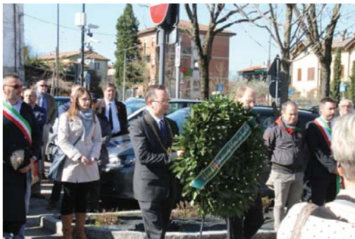
Kranzniederlegung in Albinea