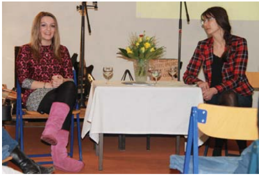
Buchvorstellung „Europäisch leben in Treptow-Köpenick