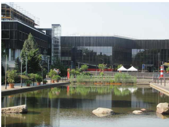
Rückseite des Hauptgebäudes des FEZ Berlin

Gesamtvolumen: 11,27 Mio. € davon EFRE-Mittel: 5,635 Mio. € Land Berlin: 5,635 Mio. €