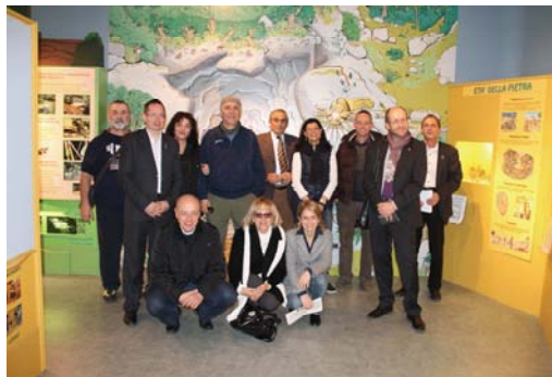
Besuch bei der „Gruppo Archeologico“