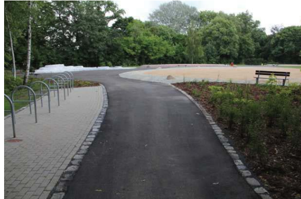
Areal des Weltkinderspielplatzes

Projekt Weltspielplatz: Auf den Flächen der ehemaligen Gaststätte am Plänterwald, zwischen Abteibrücke und Puschkinallee, wird die Idee eines Weltspielplatzes verwirklicht. Eine große Spielfläche wird als Welt gestaltet, die Planung hierfür wurde durch ein Kinderbeteiligungsprojekt erarbeitet. Die Kinder planten die Umrise der Kontinente sowie „kontinenttypische“ Spielgeräte. Der Bau dieser Spielgeräte soll durch nationale und internationale Sponsoren gesichert werden. Die Grundgestaltung der Anlage (Wege, Flächenvorbereitung, Pflanzung) erfolgte und erfolgt aus öffentlichen Mitteln. Die Baumaßnahme wurde in 2014 beendet.